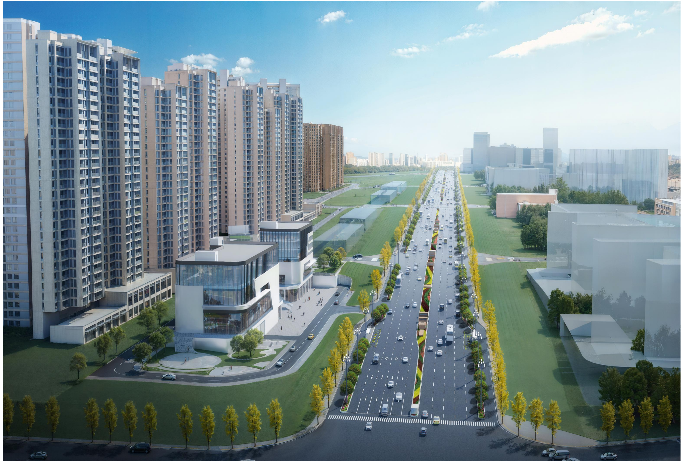
达州高新区南北三号干道综合管廊建设项目